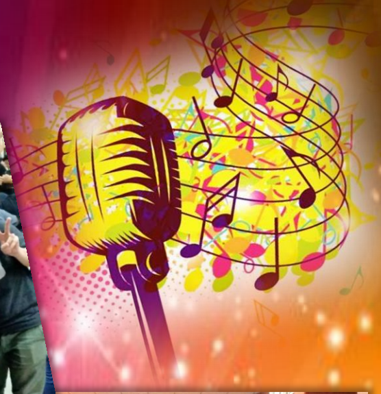
保良局安老服務歌唱 比賽暨盆菜宴